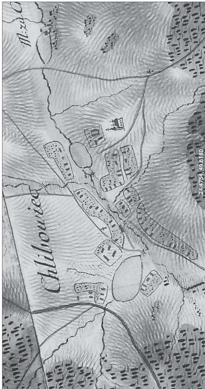
Chlebowice Świrskie na mapie topograficznej von Miegi z końca XVIII w.