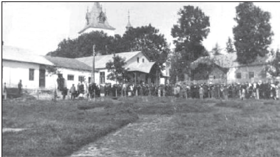
Widokówka przedstawiająca uroczystość kościelną w Dunajowie, 1934 r.