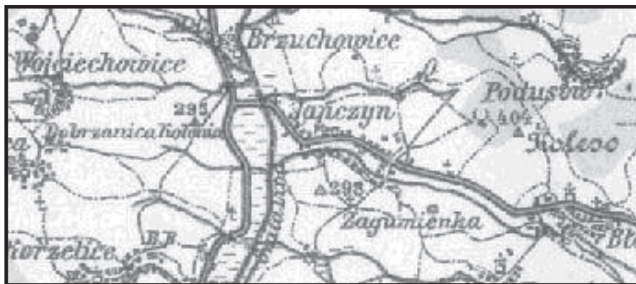
Wycinek austriackiej mapy topograficznej Übersichtskarte von Mitteleuropa.

czas byłby spokój.” Do pogroźek „rizaty Lachiw“ nadtośmy się przyzwyczaili. Wykrzyki zaś, aby rozpedzić becyrki i żandarmów na cztery wiatry, są dla nas istną nowalią. Pogrożki podobne mają swe źródło w nieustannych agitacjach, które między ludem nurtują. Jest to dopiero rzucony siew, którego zaczyna kiełkować, lecz kto wie, czyli przy obudzeniu się zdrowego rozsądku nie obróci się przeciwko samym siewaczom, którzy przy wywrocie społecznego porządku w mętnej wodzie zamierzają ryby łowić.