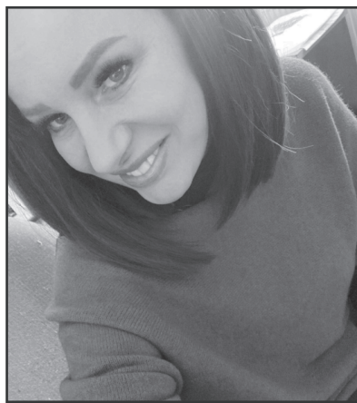
Autorka wspomnień, fotografia z 2023 roku.