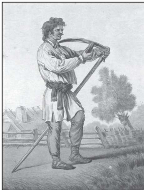
Chłop polski przy pracy, XVIII wiek.

– Miłościwy królu i panie nasz! Naród polski wierny był zawsze i jest panom swoim, po Bożej łasce i po dusznem zbawieniu swoim, ni-